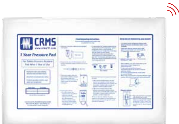
Détecteur de lit