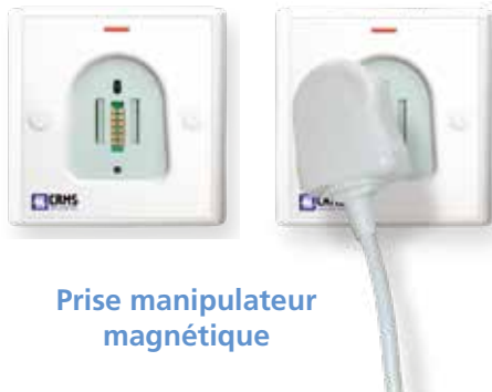
Prise manipulateur magnétique