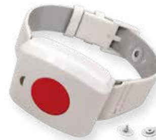
Émetteur de poignet