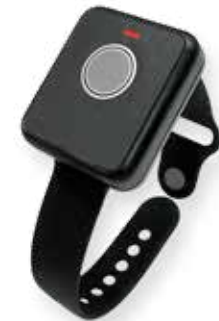
Détecteur de poignet