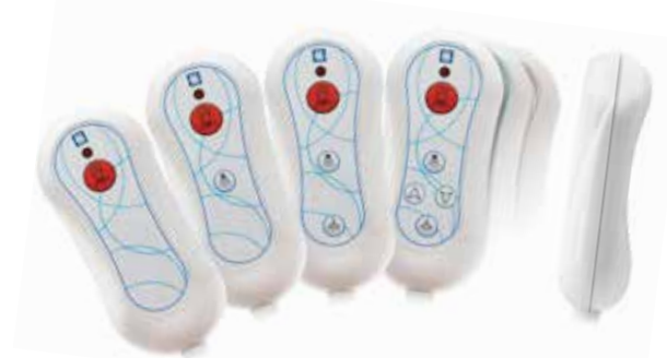
Manipulateur IP67 à connexion magnétique de 1 à 5 fonctions