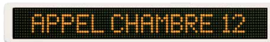
Visualisation de couloir ou d'office