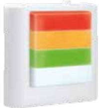
Hublot de signalisation