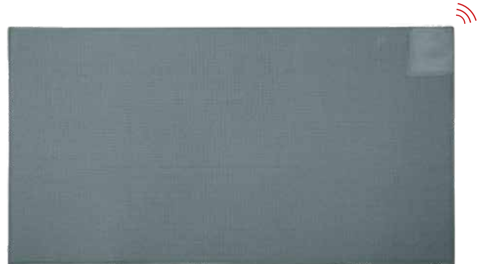
Détecteur de sol