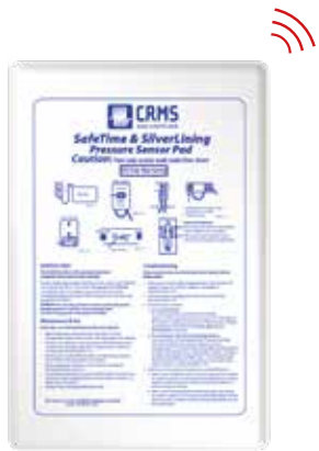
Détecteur de chaise