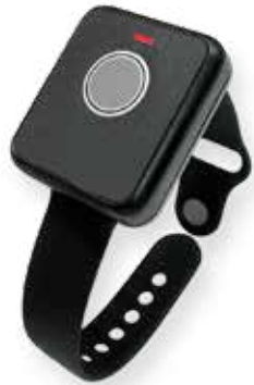
Émetteur de poignet