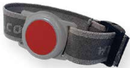
Émetteur de poignet