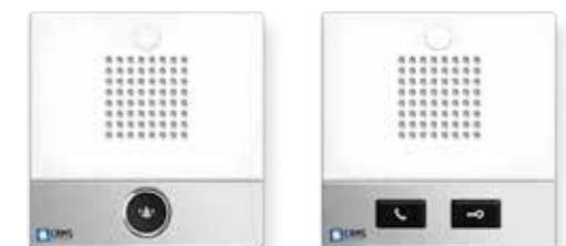
Terminaux de chambre avec interphonie SIP