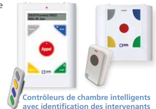
Contrôleurs de chambre intelligents avec identification des intervenants