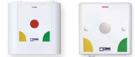
Contrôleurs de chambre