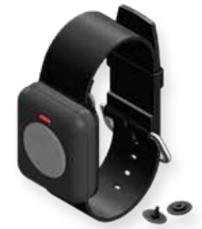
Émetteur de poignet